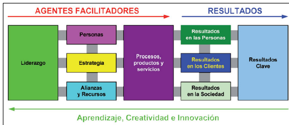
Fig. 3. Agentes Facilitadores y Resultados.

El Esquema Lógico REDER es una poderosa herramienta de gestión y una manera estructurada de evaluar el rendimiento de una organización.