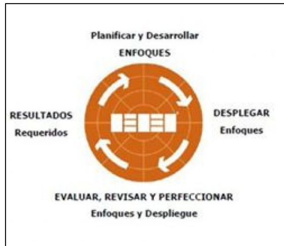
Fig. 4. Lógica REDER.

A nivel institucional, los TRES elementos descritos anteriormente se relacionan entre sí para construir un sistema coherente con el que hacer de la Universidad y sus diversos elementos de planificación, como son: